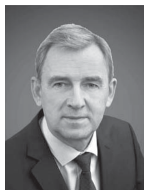
Александр АРТЁМОВ, председатель Законодательного Собрания Омской области